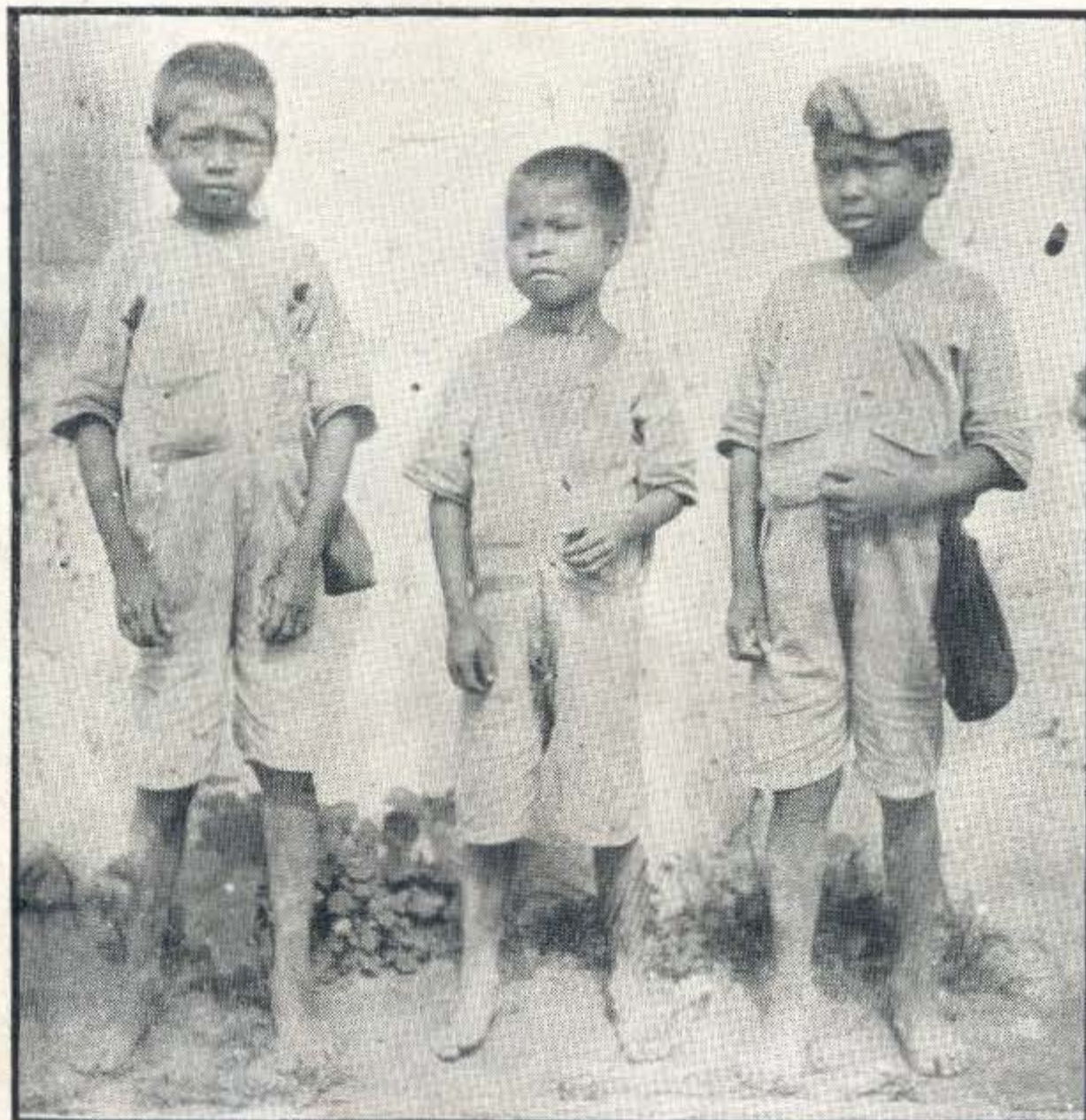
Fig. 2. Muchachos Tamainde-Nambikuara de la Invernada de Tres Buritís. Utiáriti.