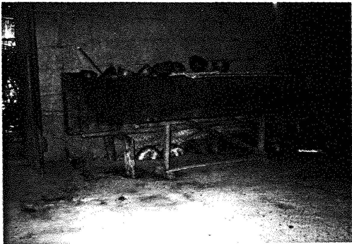
FIG. 9 Cocho feito de tronco de árvore utilizado para armazenar a chicha pronta para ser bebida