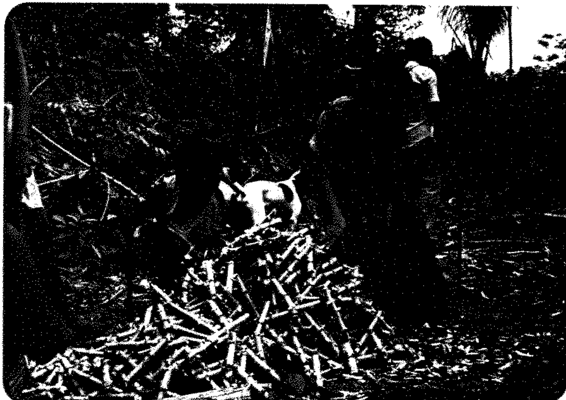
FIG. 3 Mulheres Jaboti durante um mutirão para plantar macaxeira