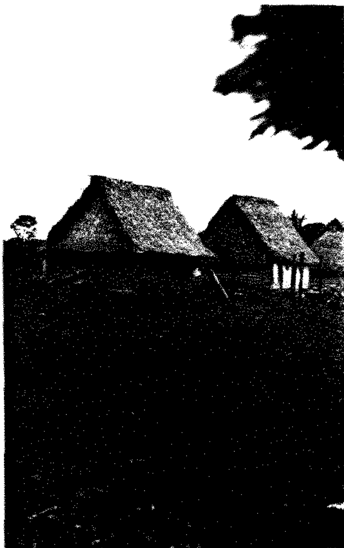
FIG. 2 Habitação típica do P.I. Guaporé