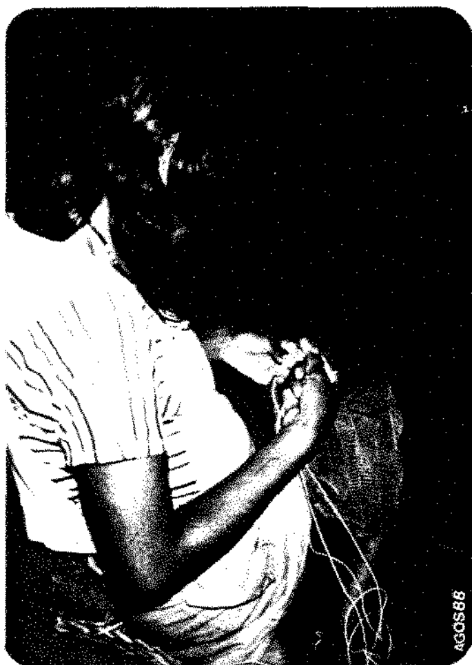
FIG. 6 Mulher Makurap tecendo marico