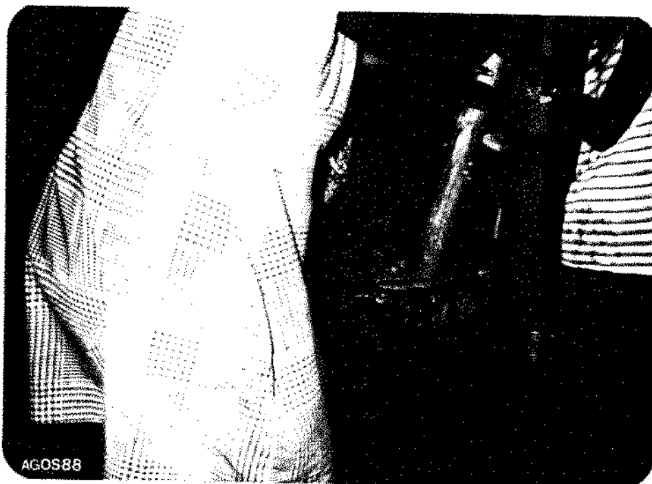
FIG. 8 Moendo a macaxeira cozida para fazer a chicha