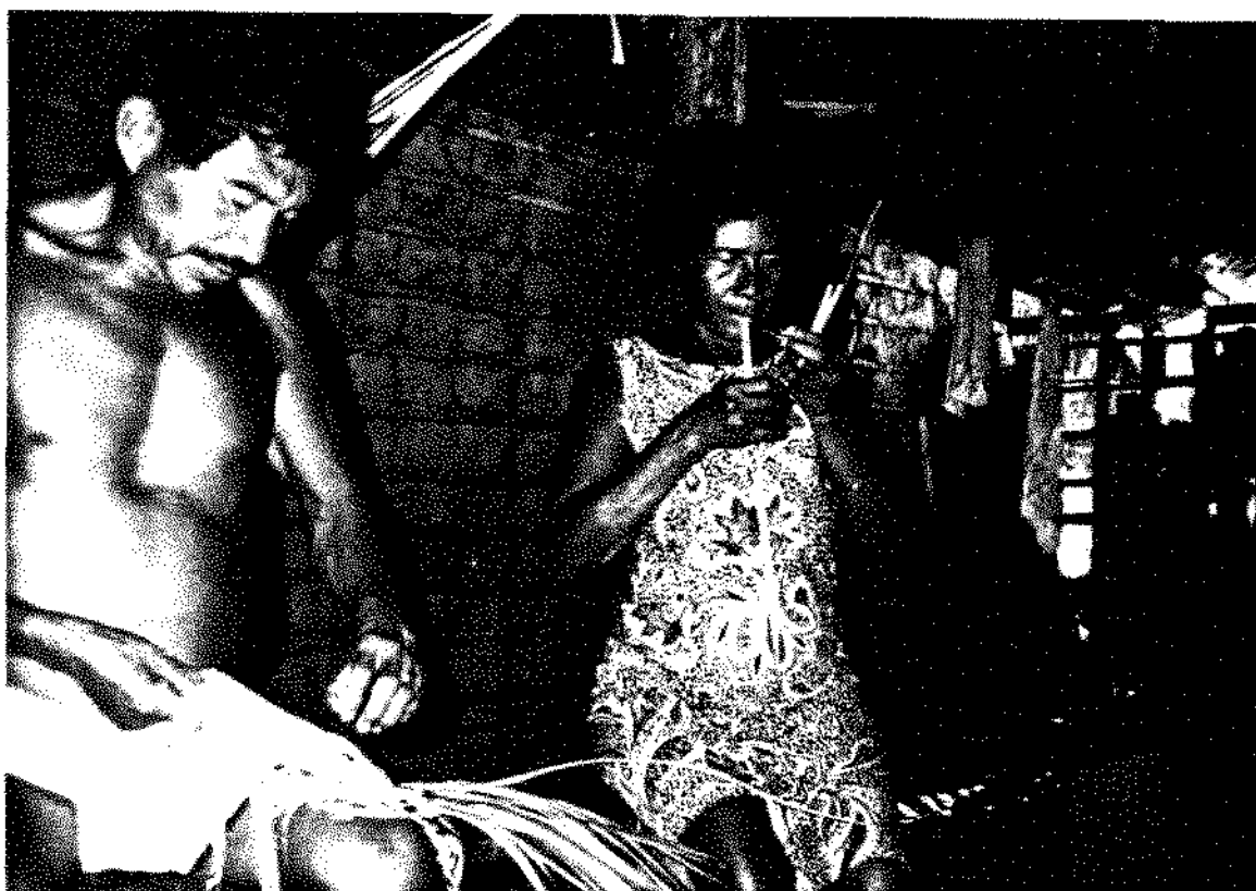
FIG. 5 Casal Makurap extraíndo fibra da palha do tucum para tecer linha de fazer marico