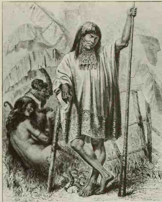
Índio Conibo. Expedição de Paul Marcoy (1848-60).

Em 1682, os jesuítas entram em cena no Ucayali e estabelecem o primeiro contato com os Conibo, enquanto perseguiram um grupo de Shipibo fugidos de La Laguna. Em 1685, o padre Richter consegue fundar uma missão. Mas enquanto ele se ausenta, para ir a La Laguna se reabastecer de ferramentas de metal indispensáveis para a propagação da fé (uma viagem de vários meses), uma expedição franciscana visita sua missão e pretende assumi-la.