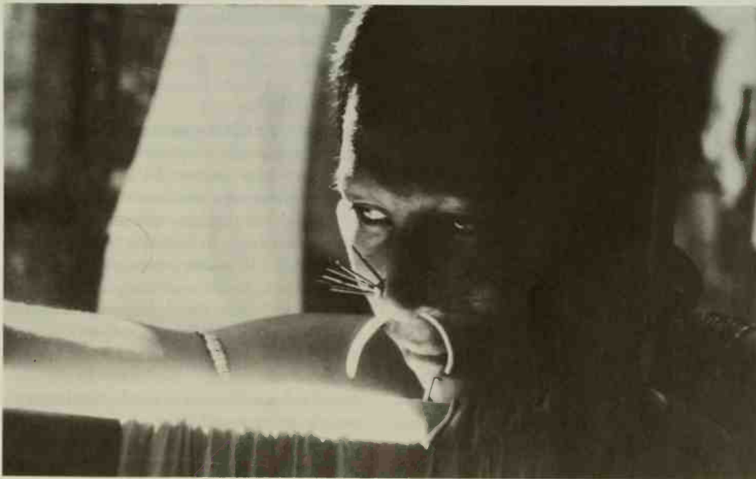
Retrato de um Matis.

— Os Cashibo , antes de sofrerem, no início deste século, uma influência shipibo maciça, estavam entre os grupos pano mais isolados devido à sua temida belicosidade. Seu hábitat e sua língua diferem mais do que a média dos outros Pano, com quem, contudo, sem dúvida se parecem, e com os quais o contato sempre foi mantido, no mínimo por inter-