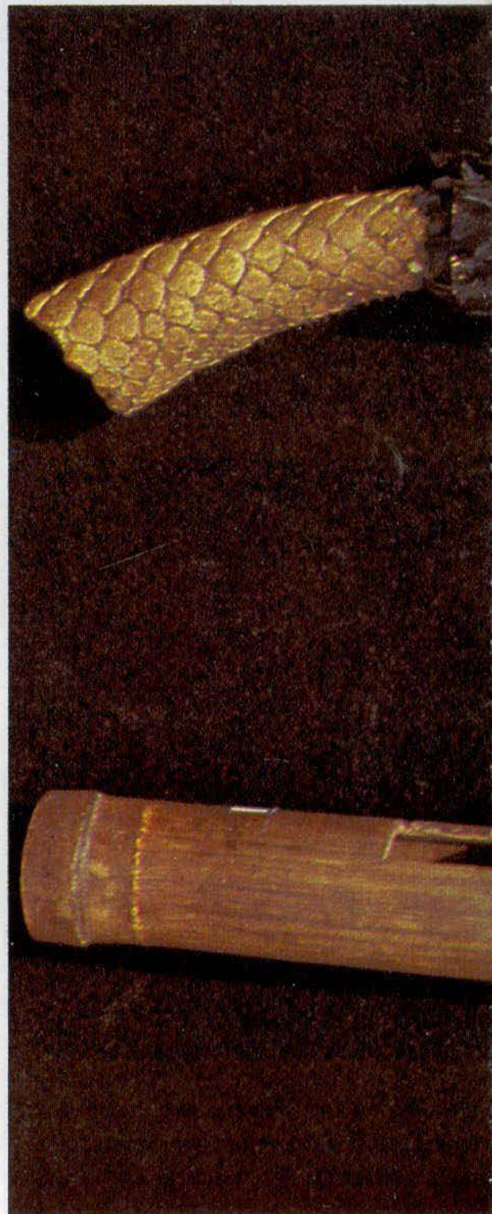
São diversos os materiais usados pelos índios para a confecção de suas buzinas. Ao alto, buzina de bambu Kaiapó; em cima, buzina de madeira dos Erigpactsá; e, ao lado, buzinas de chifre e de rabo de tatu dos Canela e Kaiapó.