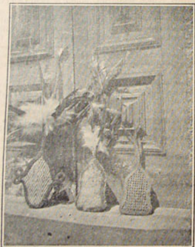
Çarys ou luvas usadas na "Dansa da Tocandira"

hoje se usam, dir-se-ia pertencerem a alguma antiga tribo hoje extinta. A tradição os liga à lenda do ARÚ, e seriam os restos do remo, de que ele se serve quando traz a MÃE da Mandioca. Afirmam que trazem prosperidade a quem os encontra e que basta queimar um pedacinho do remo do Arú, quando se queima o roçado, para que nunca mais abandone a roça e para ela traga sempre a MÃE da Mandioca. A forma do remo, que é de madeira duríssima, é a de uma pá de forneiro, da altura de um metro e pouco, sendo o comprimento da pá de um terço.