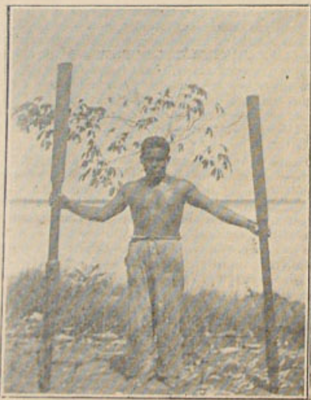
Um mestiço maué, pilador de guarana

Em nossos dias, estudando outros agrupamentos indígenas do Vale Amazônico, como os Parintintin, os Apiaká, os Kuruayá, Curt Nimuendajú, insigne etnólogo nele radicado, depois de revolver grande parte das fontes históricas, ora referidas, foi levado a considerar, numa travessia do Tapajós para o Amazonas, descendo pelo Mariacua abaixo, alguns indivíduos da