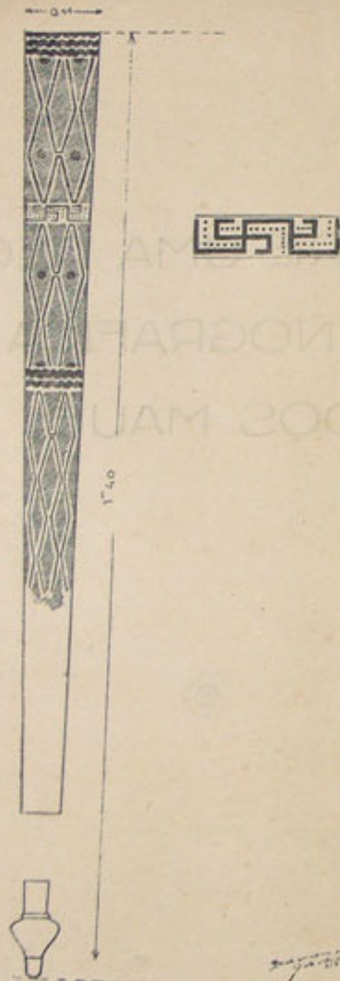
O "Porantin" ou Remo Mágico dos Maué, num desenho de Barandier da Cunha.