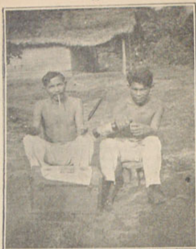
Um pagé e seu ajudante

CANIA — denuncia as secretas correspondências da alma primitiva dos MAUÊ com o mundo mitológico e com o mundo tropical e ainda lembra áquele povo os fundadores e os chefes da tribo, quer numa ação heróica, quer numa cerimonia religiosa, quer numa atitude de magia. Contemplemos, portanto, a peça que aí esta, nas fotografias tomadas na TERRA PRETA.