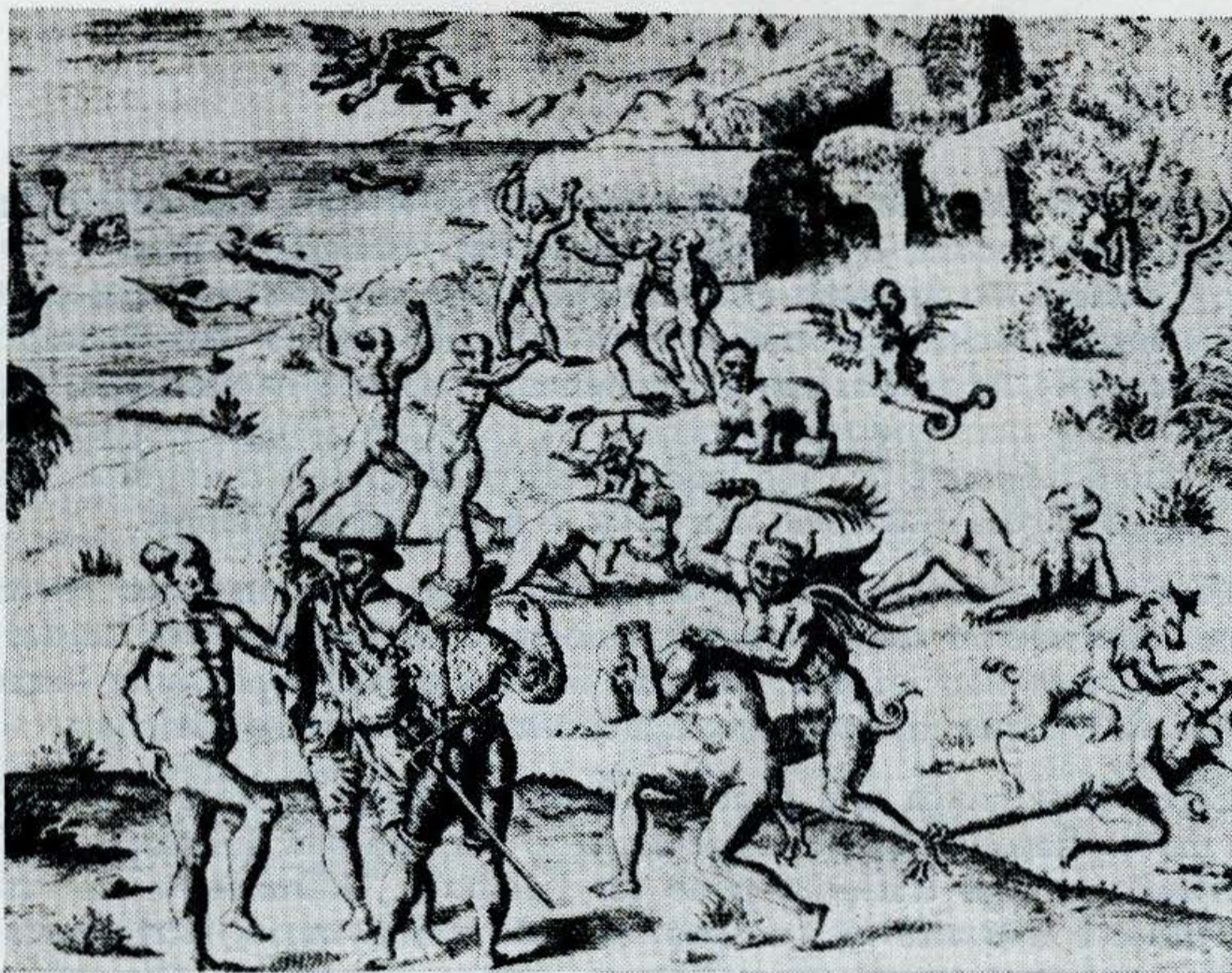
Foto 1 – “Os brasileiros e os diabos”. Extraída de Jean de Léry (1941).