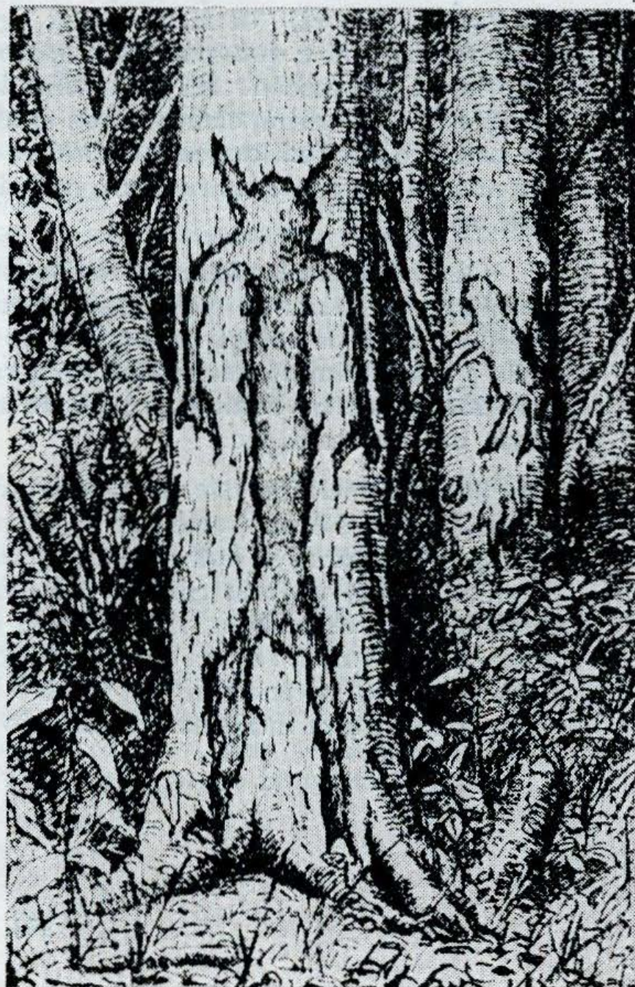
Foto 2 – Figura entalhada dos Nahuquá. Extraída de Karl von den Steinen (1940).