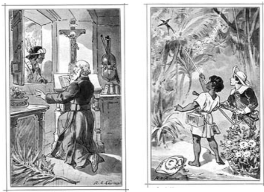
Imágenes 7 y 8. Josef Spillmann. Tapa y láminas interiores de “La fiesta de Corpus en Chiquitos”, Friburgo, ed. Herder, 1901.

aparece como la figura testimonial por excelencia de la evangelización lograda. Su presencia certifica el “haber estado allí” y otorga visibilidad a una idea que los jesuitas remarcaron insistentemente en sus discursos: el estar con y entre los indígenas, “protegiéndolos y educándolos”. (Imágenes 7 y 8)