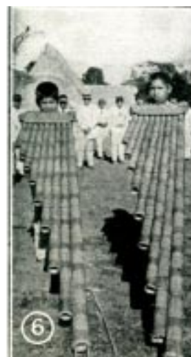
Imágenes 9 y 10. Álbum Bolivia en el Primer Centenario de su Independencia, s/d. 1925 Las imágenes aparecen descritas como: “Monseñor Carola, rodeado de un grupo de abadesas mojeñas” y “Los bajones, instrumentos de música que se tocan en las grandes ceremonias oficiales y religiosas”