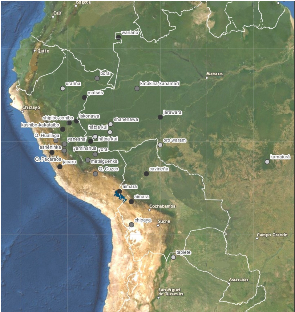
Mapa 1: Ubicación geográfica de las veintiséis lenguas sudamericanas examinadas. En gris oscuro, las lenguas que emplean SD; en gris medio, las lenguas que emplean SD limitado o solo deícticos; en gris claro, las lenguas que no emplean SD.