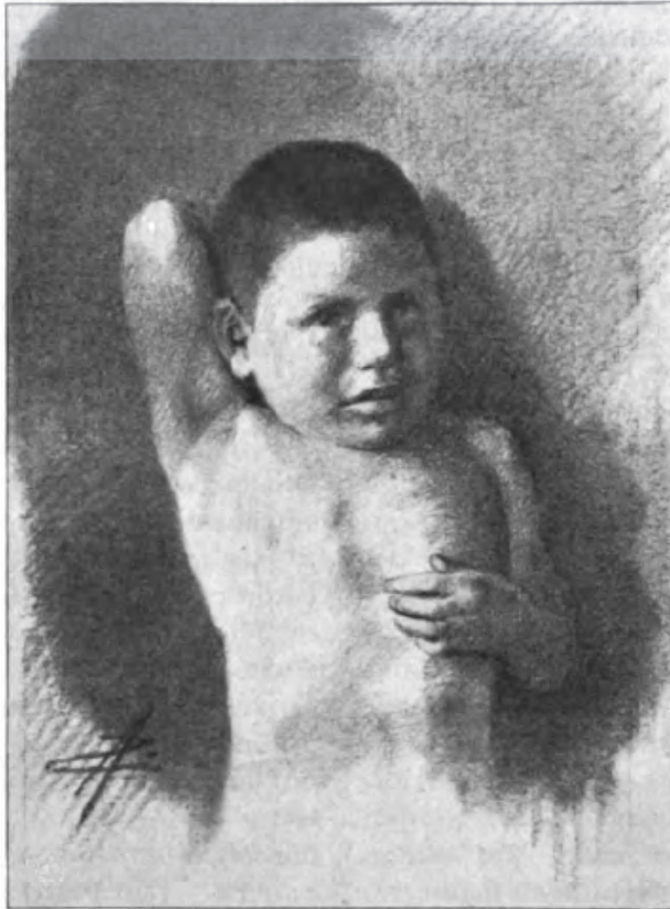
Figura 1: Uma criança Botocudo.

de tempos em tempos. O derramamento de sangue leva ao derramamento de sangue e este parece ser o lema de ambos os lados, quando uma atrocidade parece levar à outra. Ora os brancos, ora os selvagens buscam um acerto de contas baseado em infundáveis retaliações mútuas.