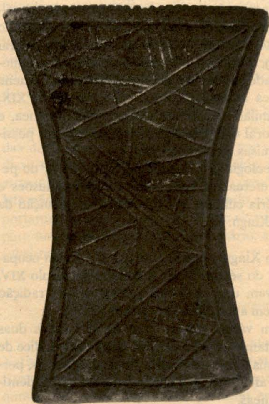
Fig. 49 Miararé, placa quadrilátera. Altura: 17 cm. Coleção Museu Goeldi, Belém. Clichê: José Caster, Musée de l'Homme.