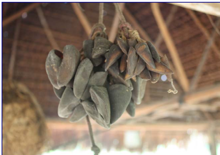
Foto 62: Colares antigos pendurados na Aldeia Kanoé (Gilmar Ferreira – T. I. Rio Omeré – mar/2010)