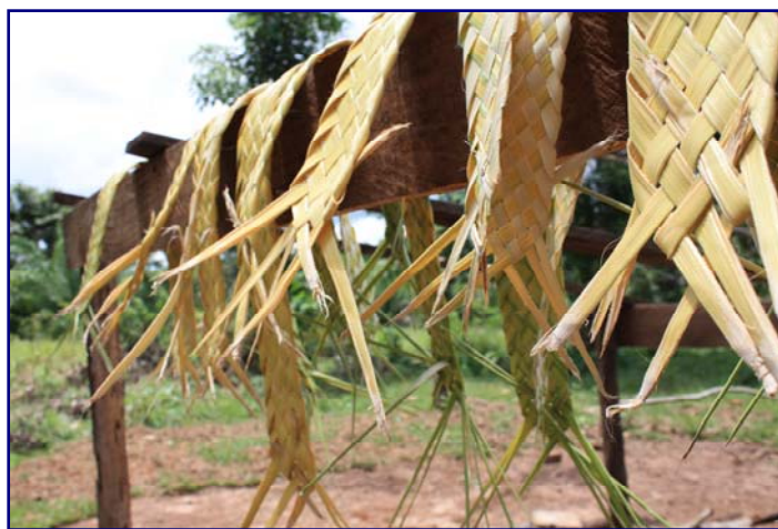
Foto 48: Bandoleiras de palha de buriti trançada produzidas na oficina de resgate cultural para o projeto Kanoé/ PRODOCLIN (Gilmar Ferreira – T. I. Rio Omeré – mar/2010)