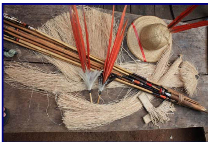
Foto 23: Peças de indumentária de fibra de buriti, chapéu e flechas: a identidade visual e etnocultural do povo Kanoé (Gilmar Ferreira – T. I. Rio Omeré – mar/2010)

Com as fibras obtidas, os Kanoé produzem as três peças essenciais do conjunto de sua indumentária: a grinalda, os pingentes longos para os braceletes e a tanga (ou avental), que se harmonizam com o chapéu com penas vermelhas de rabo de arara. Além disso, com as fibras de buriti produzem linhas, barbantes, cordas, maricos e redes de dormir e redes de pesca: