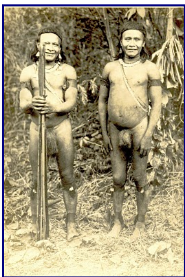
Foto1: Índios Kapixaná ( Kanoé ), Tiaré (arco e flecha nas mãos) e Gualuré, rio Pimenta Bueno, sem data. (legenda localizada no verso da fotografia)

Há, entretanto, dois elementos que permitem atar o presente ao passado: os brincos no formato triangular ou semi-trapezoidal e o que poderíamos chamar de “chapéu típico Kanoé”. Esse elemento, que a rigor não era uma chapéu, mas um conjunto de gorro e uma aba de trançado sobreposta, visto mesmo de perto, dava a impressão de um chapéu inteiriço. Pelas informações prestadas por MK1 e TK2, parece que esse elemento foi desenvolvido pelos Kanoé a partir dos primeiros contatos em os “civilizados”, no final da década de 1920 e início da década de 1930. De fato, nas duas únicas fotos disponíveis na web, cujos índios retratados são identificados com Kanoé ou Kapishana , não se nota o uso do “aba-e-gorro”, o suposto chapéu, mas nessas fotos podem ser observados os brincos, exatamente no mesmo formato encontrável hoje entre os “ Kanoé isolados do Omeré ”.