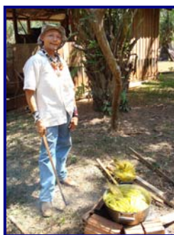
Foto 15: Purá Kanoé fervendo pätäj erejkuta (bolas de buriti) (Gleice Mere – T. I. Rio Omeré – ago/2008)