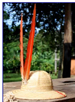
Fotos 34, 35 e 36: O chapéu kanoé de corda azul e de palha fina, ambos com penas de rabo de arara. (Gabriel Morand – Omeré - ago/2008; Gilmar Ferreira – Omeré – mar/2010)