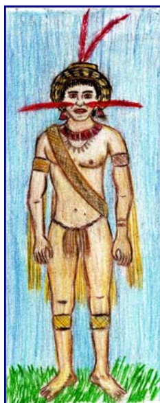
Ilustração 4: Indumentária tradicional Kanoé, reconstituição cf. informações de MK1, TK2, FK6