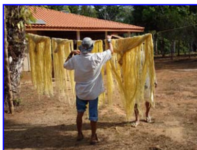
Foto 21: Purá Kanoé trabalhando as pütäjty (fibras de buriti) (Gleice Mere – T. I. Rio Omeré – ago/2008)