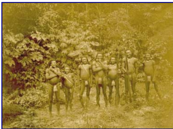
Foto 2: Índios Kapixaná ( Kanoé ), Rio Pimenta Bueno, afluente do Rio Machado, Mato Grosso (sic!), sem data.