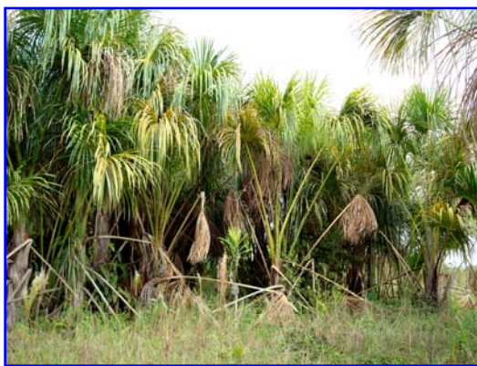
Foto 1: Buritizal no Omeré (Gleice Mere – T. I. Rio Omeré – ago/2008)

O buriti pode ser encontrado como palmeira solitária ou em conjuntos mais ou menos densos, conhecidos como “buritizais”. Como palmeira exige muita água no solo, germina e cresce em terrenos úmidos, à margem de igarapés, nascentes, pequenos lagos brejos, nas chamadas “veredas”. Embora resistente, a palmeira se adapta melhor, cresce e se reproduz com vigor em solos alagados ou alagadiços, razão pela qual uma touceira de buritis é um indício da existência de água ou cursos d'água nas proximidades.