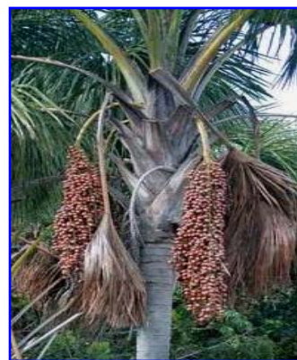
Foto 2: Cachos de buriti (G. Morand – T. I. Rio Omeré – ago/2008)

Como palmácea importantíssima nas culturas indígenas e populações interioranas das regiões onde ocorre, trata-se de uma espécie da qual quase tudo se aproveita: