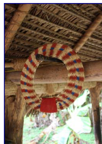
Foto 30: Aba de “chapéu Kanoé”: produção recente na aldeia do Omeré (Gilmar Ferreira – Omeré – mar/2010)