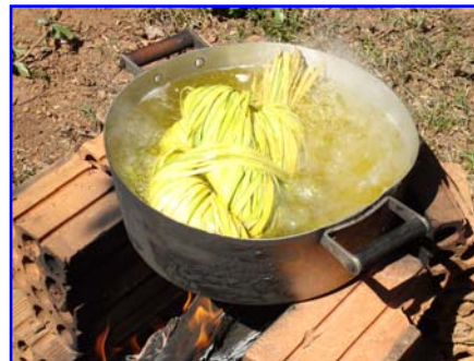
Foto 16: As pätäj erejkuta (bolas de buriti) são cozidas por algum tempo

Depois de fervidas, as pätäj erejkuta são desenroladas e estendidas para esfriar, escorrer e secar. Enquanto isso, os Kanoé continuam o processo de desfiamento, agora em fibras cada vez mais finas, separando-as e alisando-as para retirar os fiapos indesejáveis: