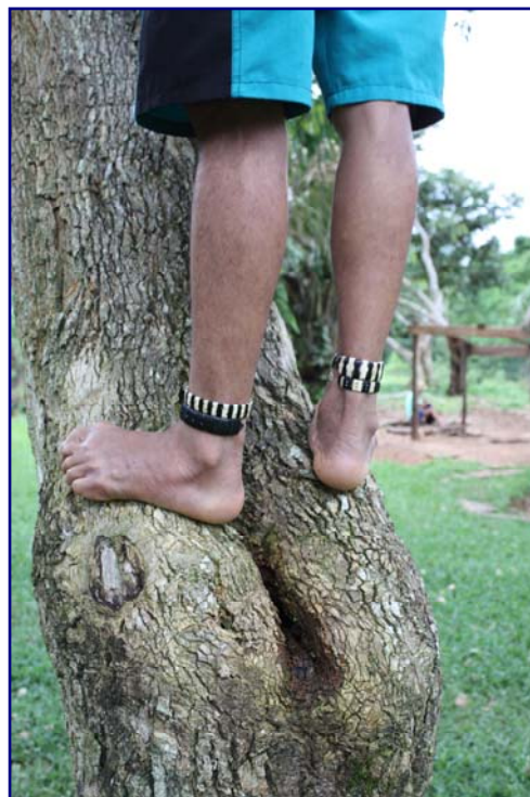
Fotos 60 e 61: Botoque nasal e tornozeleiras usadas por Purá Kanoé (Gilmar Ferreira – T. I. Rio Omeré – mar/2010)