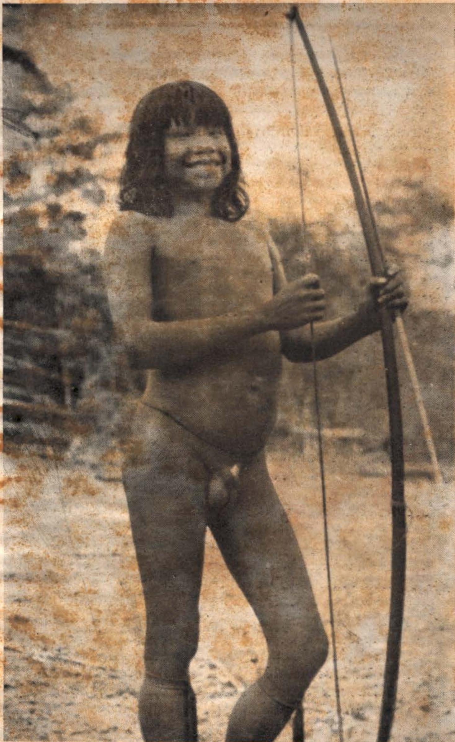
Jovem índio Tapirapé.