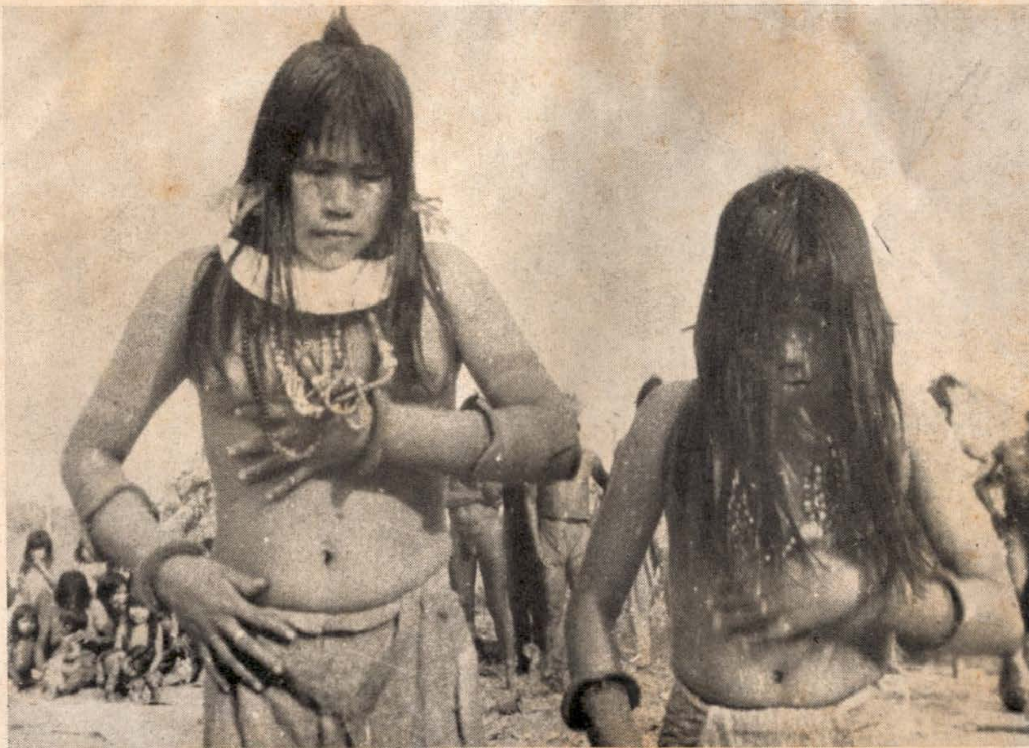
Moças Carajás em plena dança.