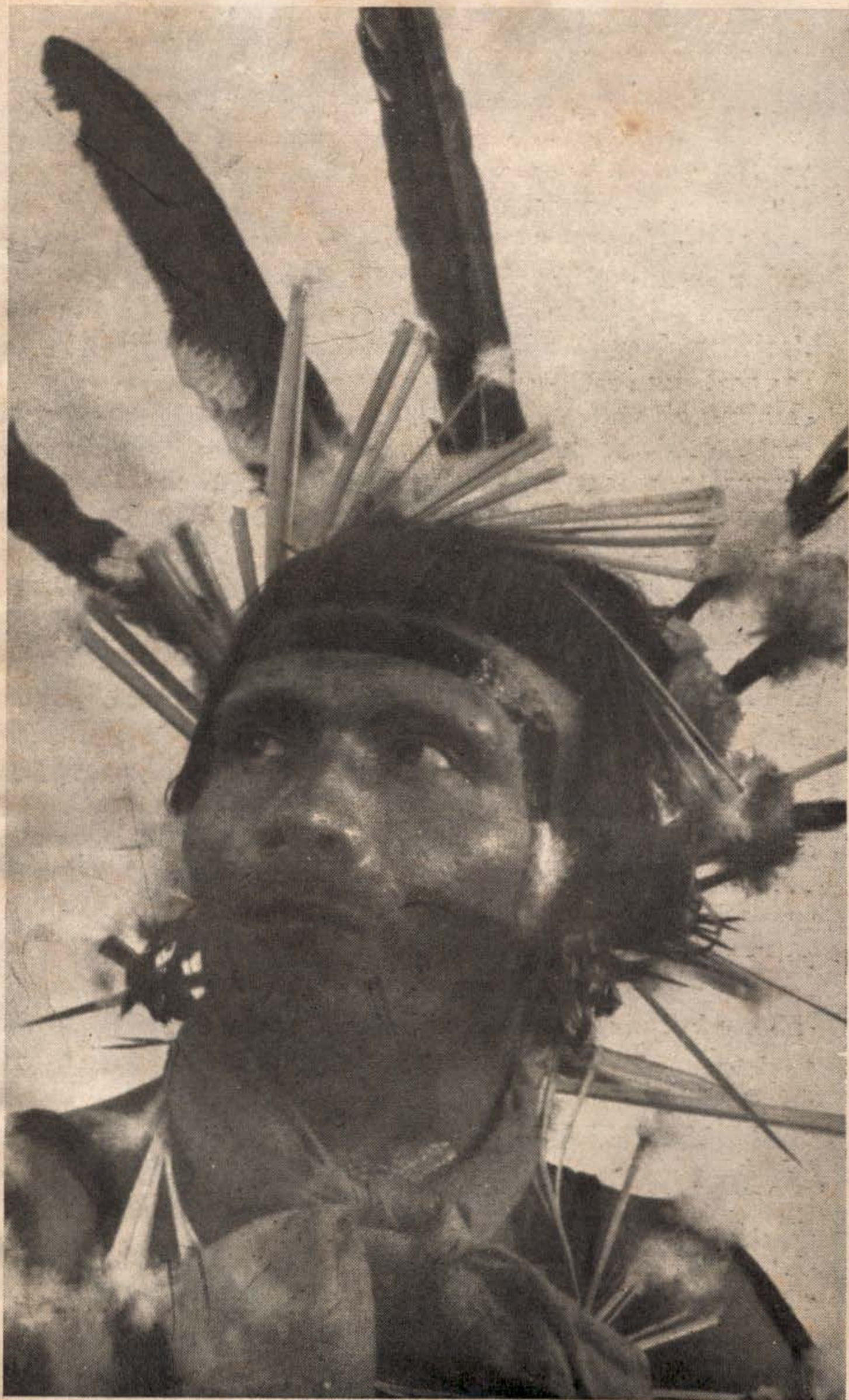
Belo tipo de índio Borôro.