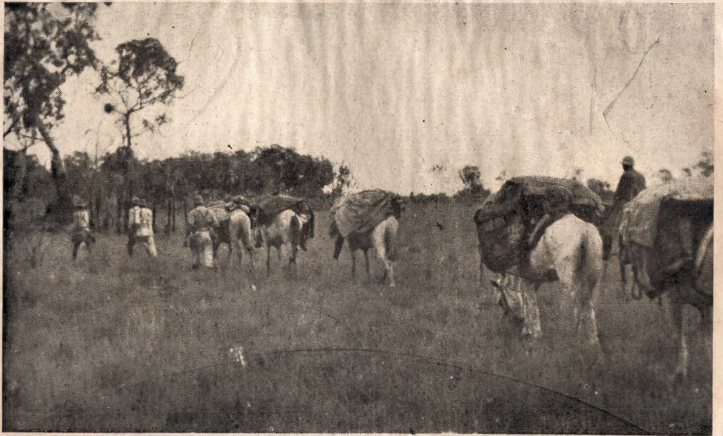
Em plenas gerais nos territórios Caiapós.