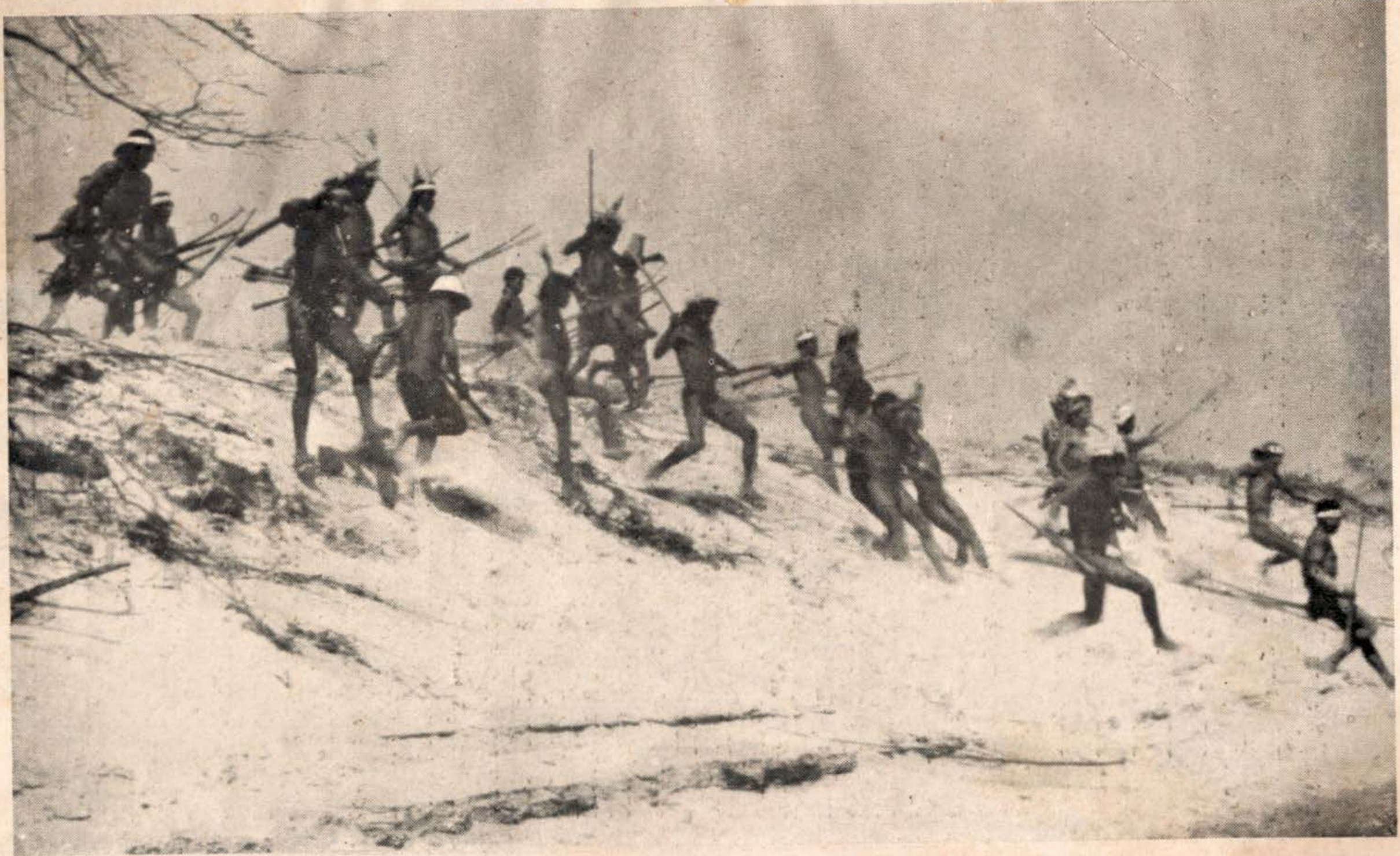
Guerreiros Carajás ao longo do Araguaia.